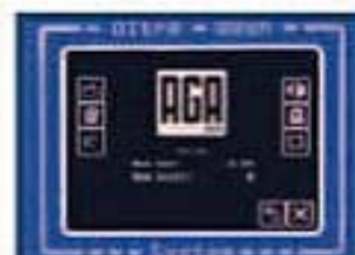
Microproc. Easy Touch