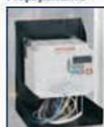
Inverter 1000 rpm

Pannelli inox disponibili a richiesta senza alcun aumento di costo