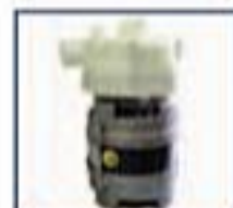
Pompa di scarico