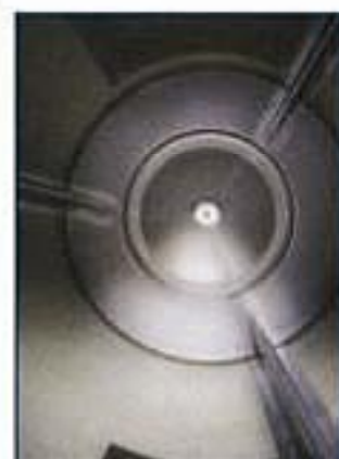
Cestello Inox AISI 304 Standard