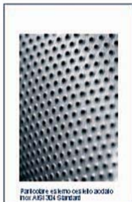
Particolare estremo cestello acciaio Inox AISI 304 Standard

Riscaldamento elettrico con kW maggiori di senza alcun aumento di costo.