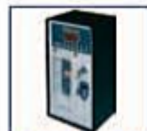
Kit gettoniera elettronica

Pannelli inox disponibili a richiesta senza alcun aumento di costo