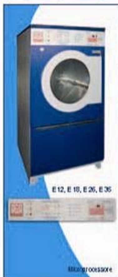
E 12, E 18, E 26, E 36

Riscaldamento a vapore: specificare alta o bassa pressione. Postorizzontamento automatico. 4.200 euro